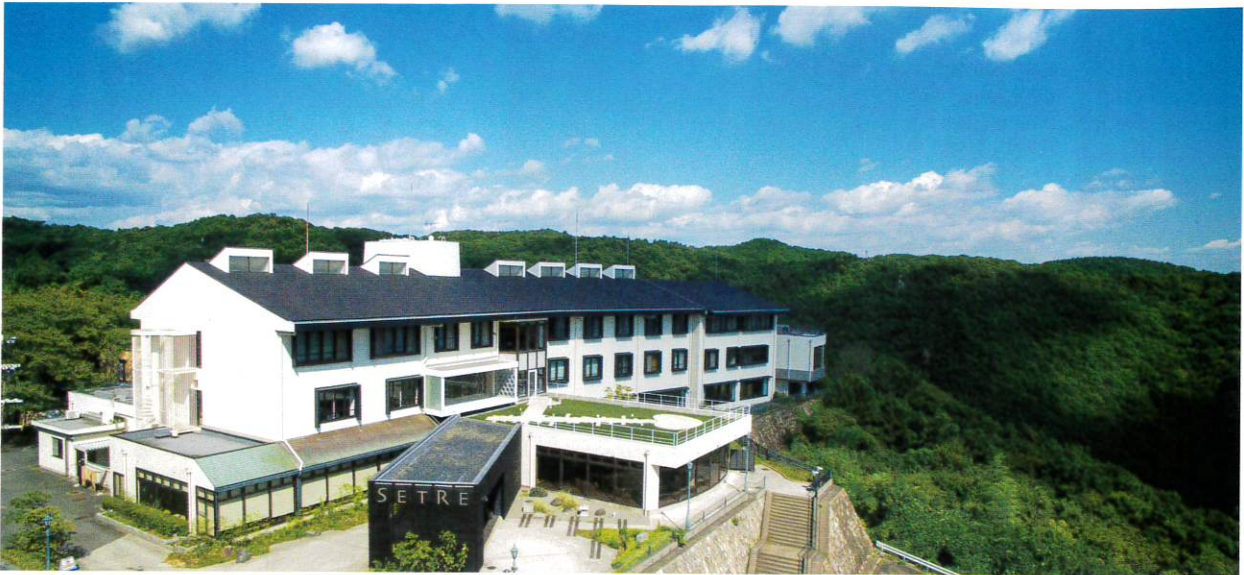
姫路の奥座敷・広嶺山に佇むオーベルジュ

地域とのつながりを大切にしているセトレ ハイランドヴィラ姫路。サウナ後には料理長らが生産者を訪れて厳選した地元の食材を堪能できる。美味しい食と地酒が、心身をリラックスさせる