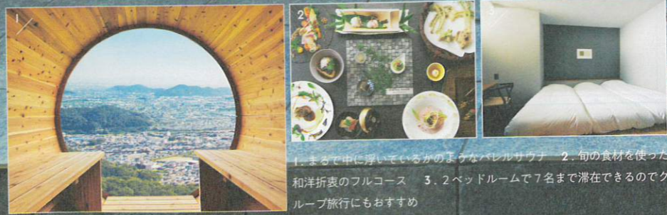
1.まるで中に浮いているかのようなバレルサウナ 2.旬の食材を使った和洋折衷のフルコース 3.2ベッドルームで7名まで滞在できるのでグループ旅行にもおすすめ